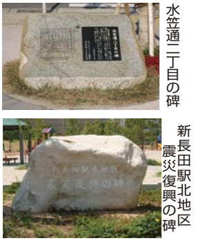
水笠通二丁目の碑 新長田駅北地区 震災復興の碑