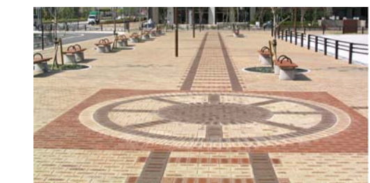
鷹取駅北駅前広場歩道部分

2 3 妙法寺川左岸公園・鷹取駅北公園 鷹取駅北エリアでは、近隣公園として、妙法寺川左岸公園を計画し、平常時は地域住民の憩える場として利用し、非常時には近接する公園等と併せ防災総合拠点となるように整備されています。 また、街区公園として、鷹取駅北公園が整備されています。