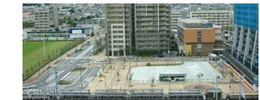
鷹取駅北駅前広場