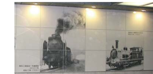
鷹取駅地下道に整備された陶版