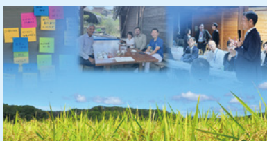
日本酒をコアにした 農業の多面的価値創造へ

ノーベル賞晩餐会の銘酒「福寿」で有名な270年続く酒蔵。酒米づくりも持続可能にする「サステナブル・トランスフォーメーション」に挑戦し、エコツーリズムを含む国際ブランド化を進めます。