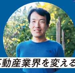
不動産業界を変える