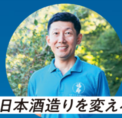
日本酒造りを変える