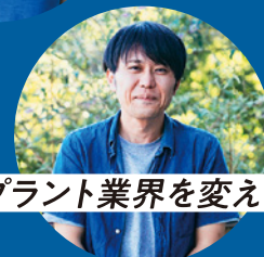
プラント業界を変える