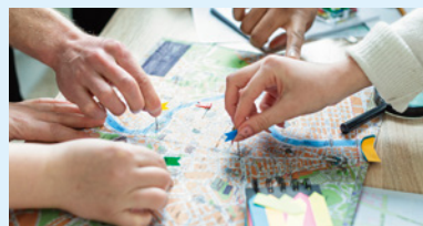
共感価値起点の 不動産ビジネス開発を進めてまいります

社会変化に対応できていない不動産業界と地域のあり方のアップデート。市街地の遊休不動産を経済的価値だけでなく社会的価値も含めて高めていきます。