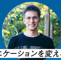
コミュニケーションを変える