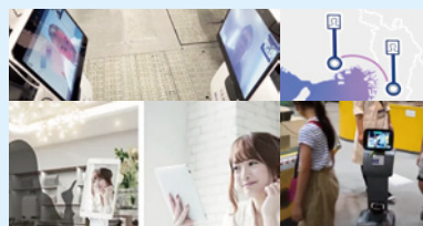
地理的・物理的制約を取り払い、我々人間の ポテンシャルを最大限に引き出せる世界を実現します。

テレプレゼンスロボットとデジタルツイン技術を活用した「TAAS」(Teleportation As A Service)を実現。地理的・物理的制約によるコミュニケーション上の垣根を取り払います。