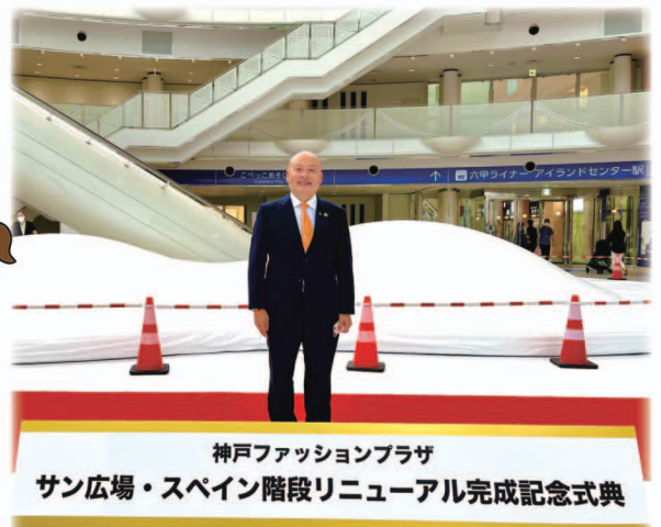
神戸ファッションプラザ サン広場・スペイン階段リニューアル完成記念式典