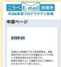
「こうべE-mail 接種券」 申請ページ (WEB)