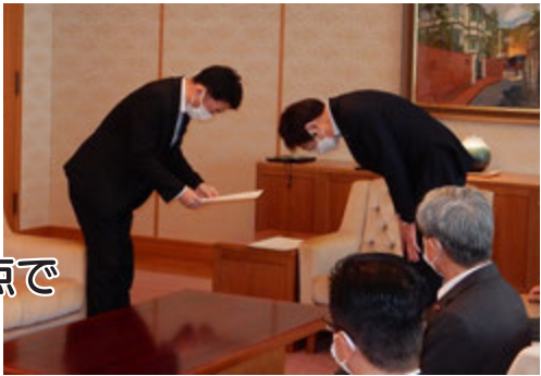
市長からの辞令交付の様子

議会の役目である行政のチェックと共に、さらに厳しい視点で税金を1円でも無駄にしない覚悟で臨んで参ります