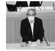
議員定数削減条例に対 する質問の答弁に立つ

人口が同規模 程度の川崎市 (一六〇)や福岡市 (一八二)の議員定 数等を考慮し、 今期と来期で現 行定数六九名を九名減(定数六〇 名)することを前提とし、今回は 四名減の六五名とし、区別議員定 数については、直近の国政調査結 果による人口比例に基づき配分を 行い、東灘区、北区、垂水区、西 区で各一名減することにしました。