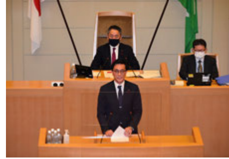
会派を代表し本会議にて質問

また、今年度は、「福祉環境委員会」、「大都市行財政制度に関する特別委員会」に所属となり、神戸市会議員として4年目を迎えました。市内の新型コロナウイルス新規感染者が増加傾向となり、「第7波」との認識が示されましたが、市民のみなさまが安心・安全に暮らせるよう全力で取り組んで参ります。