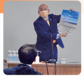
海釣りに関する質疑の様子

今年5月のゴールデンウィークに、六甲アイランドのマリンパーク再整備の一環として「海釣りエリア」が開設。3日間で約1100人が来場しました。当日のアンケートの結果から、今後釣りゾーンが導入された場合、「金額次第で利用する」も含め、 88%に及ぶ好意的な回答 がありました。