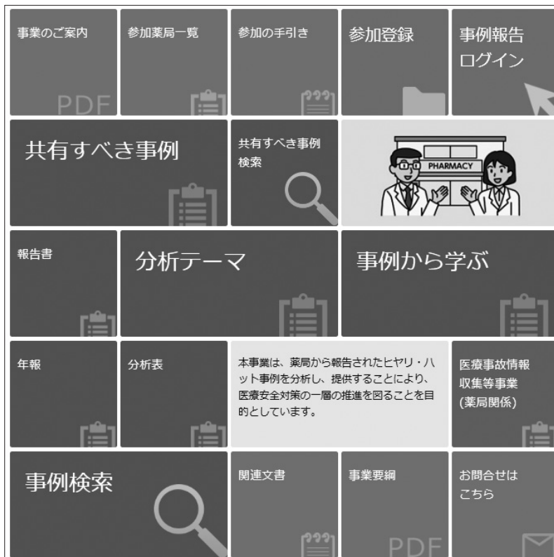
図表IV-1 ホームページのトップ画面

本事業では、事業計画に基づいて、報告書や年報、共有すべき事例、事例から学ぶなどの成果物や、匿名化した報告事例などを公表している。本事業の事業内容の掲載情報については、パンフレット「事業のご案内」に分かりやすくまとめられているので参考にさせていただきたい ( https://www.yakkyoku-hiyari.jcqh.or.jp/pdf/project_guidance.pdf )。