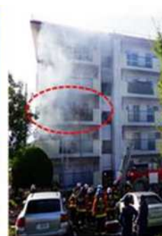
出火建物南面の状況