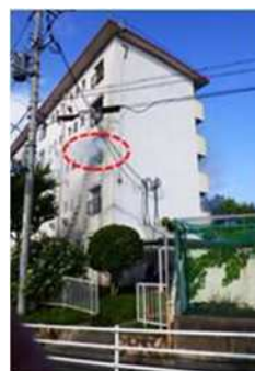
出火建物北面の状況