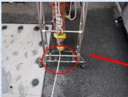
三連はしご下部 救出ロープの状況 (踏み棧に下からロープを通す)