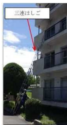
三連はしご架梯状況 (再現)