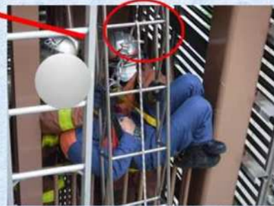
三連はしご上部の支点と 救出ロープの状況 (この状態で足場の外側へ、要救助 者役を送り出す。)