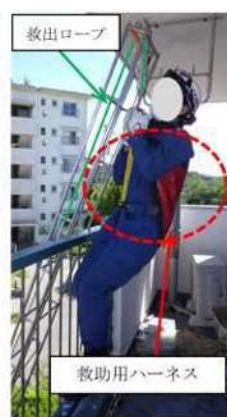
要救助者の吊り下げ状況 (再現)