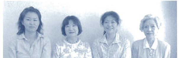
藤原 延命寺 谷川 末澤