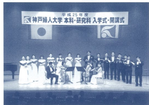
ウエルカムコンサート