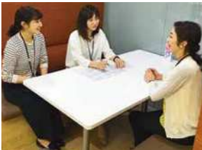
両立支援アドバイザーとの面談の様子

フジッコは、2020年11月に創業60周年を迎えます。これから、「安心・安全・健康」の強いブランドづくりの実践を通じて、新・企業理念「自然の恵みに感謝し 美味しさを革新しつづけ 全ての人々を元気で幸せにする 健康創造企業を目指します」を実現してまいります。