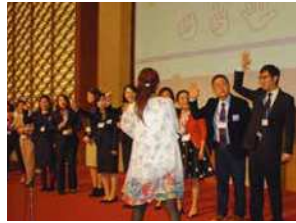
創業70周年記念式典参加4カ国社員によるじゃんけん大会です。