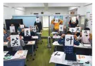
2020年最初のQOL向上研修では全員が思い思いに今年の一字を書き初めました。