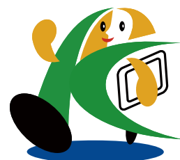
「こうべ男女いきいき事業所」 シンボルマーク