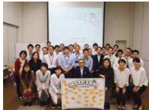
六さんと語ろうの様子