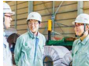
幅広い年齢層の女性が、営業、生産管理、総務経理等、様々な職種で活躍しています。

当社は2019年に創業110周年を迎えました。これからも、皆様により必要とされる企業であり続けるよう、スロウガンである「とりあえずやってみよか」の精神を大切にし、「鉄と共に」「人と共に」「地球と共に」更なる成長を目指して頑張ります。