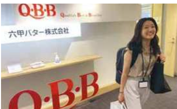
育児休業、介護休業制度もしっかり整備し、安心して働ける環境づくりを行っています。

六甲バターでは仕事と家庭の両立を目指し、社員の働きやすい環境と制度づくりを行っています。法定を上回る有給休暇取得目標を立て、取得勧奨を行っています。従業員が安心して、いきいきと働ける職場作りを進めています。