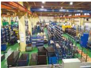
本社は神戸市西区、兵庫県内に5か所、海外は中国とフィリピンに工場拠点があります。

当社は、ショベルカーなど建設機械用の配管の製作を専門に手掛け、2019年に創業81周年を迎えました。100年企業に向けて、「全従業員とその家族の物心両面の幸せを追求すること」を理念として掲げ、社員がやりがいを持って安心して働ける環境を創造し続けてまいります。