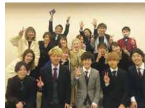
2019年度新入社員入社式。今年度も新しい仲間を迎えます。

弊社は、「神戸・働きたいサロンづくり」という経営ビジョンを掲げ、「経済的」「精神的」「時間的」の3つの豊かさの実現を追求しています。そして革新的な挑戦を行い、美容業界の「働き方の見本」となり、業界自体にも良い影響を与えることのできる会社づくりを目指しております。「社員さんとその家族の幸せ」「取引業者さん関係業者さんの幸せ」「お客様や地域の方の幸せ」の3つを実現し、「なくてはならない会社」を目指します!!