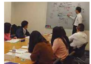
育成プログラムの一環で英語・簿記・貿易実務の講座を受講しています。