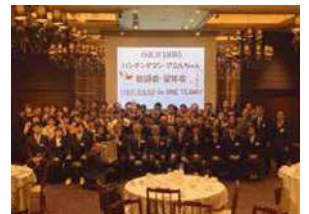
毎年恒例新入社員の歓迎会・望年会 神戸オリエンタル(京町)にて