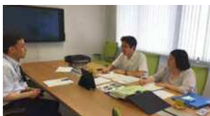
産業医・看護師による健康診断の結果面談の様子