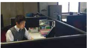
オフィスアワーにより、早朝出勤し、時間を有効活用する若手社員

当社は2018年に創業50周年を迎え、次の50年への新たな1歩を踏み出しました。女性社員の出産や育児はもちろん、男性社員も介護や単身赴任等、生活の変化が増えていることから、今後社員がどのようなライフステージにおいても、健康で、自分の生活と仕事を両立、継続できる多様な働き方が可能な企業を目指しています。