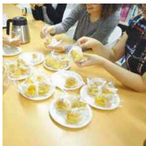
「おやつ会」月に一度、全国各地の美味しいおやつを取り寄せて開催しています。