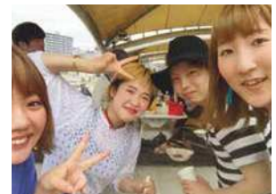
スタッフ間の交流を大切に社員旅行やBBQ等各イベントを実施。