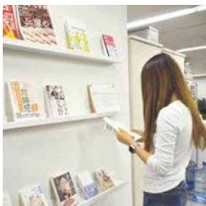
「JAM文庫」仕事へのインスピレーションから息抜きまで幅広いジャンルの書籍が揃っています。

「感動と共感をデザインします」という経営理念のもと、お客様、働く仲間とその家族、地域にとってなくてはならない会社を目指しています。これからも「デザインの力」でお客様の問題解決を実現してまいります。