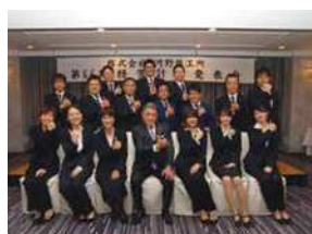
第66期経営計画発表会、毎年10月に開催しています。

弊社では、K:Wアカデミーの取り組みとしてQOL向上研修、MG研修、EG研修、マナー研修、内定者研修から幹部社員研修までフェーズに合わせた研修や資格取得支援を行い、より高度なワーク・ライフ・バランスを目指しています。