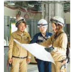
建設業でも、さらに女性が輝ける職場を目指して活躍中!