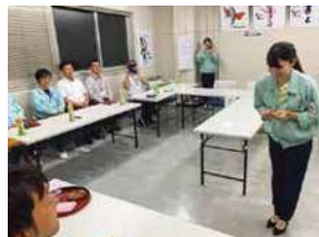
シンデレラ研修の一環『第1回来客対応ロールプレイング大会』

奥谷金網は明治28年(1895年)に神戸にて創業し、120年以上を歴史とともに歩んできました。そして現在、世界最高レベルのパンチングメタル(打抜金網)の加工技術を有しております。これからも名実ともに、世界に通用するパンチングメタルメカ-を目指し、全ての社員が誇りと挑戦を持つ企業体を目指しています。