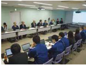
毎週月曜日は、問題点や課題を共有化し解決を図っています。

創業70余年の歴史を有する建設機械・農業機械を中心とした産業機械部品を扱う専門商社です。全世界で販売されるショベルカ等の70%に関わり、グローバルな事業展開を進めています。社員の持ち味も色々、多様な人材の持つ「つなぐ力」を最大限に発揮し、いきいきと働き活躍できる職場環境の構築を図っています。