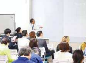
毎年数回「しごトーク」を開催し、他部署の仕事を知るきっかけ作りを行っています。

令和元年9月に新長田合同庁舎への本社移転を行い、さらに快適に働き続けることができる職場をめざし、取り組みを進めています。