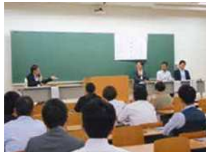
「男女共同参画周年記念フォーラム」や、男性の仕事と子育ての両立をテーマにした「父親フォーラム」などを開催しています。