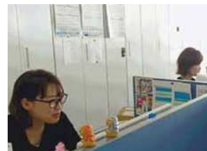
社員の約半数が女性であり、活躍しています。

「商社にとって人がすべてである」という創業者の信念に基づき、2015年にビジョン・ミッション・行動規範を策定し、ハード面・ソフト面共に働きやすい環境づくりを整備しているところです。有給休暇の消化率も高く、仕事とプライベートの両立が出来る会社です。