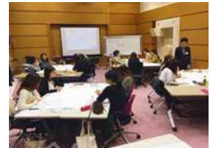
「自分らしい生き方・働き方で活き活きはたらく」をコンセプトに女性活躍研修を開催しています。