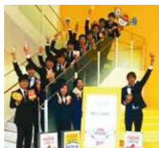
「健康で、明るく、楽しい食文化によって社会に貢献する」という経営理念のもと、社員がいきいきと働ける職場づくりを目指しています。