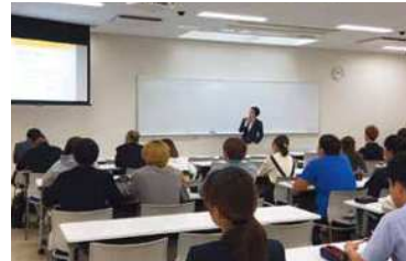
神戸学院大学にて授業のご協力をさせていただきました。

社員の成長なくして企業の成長なし。社員を大切にする「人本経営」を目指します。という指針のもと、全従業員がご子息や親族の方々に、胸を張って薦められる企業になることを将来の目標に、男女ともにいきいきと働き続けられる職場づくりに取り組んでいきます。