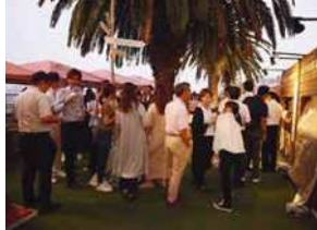
部署を越えた交流を図り、コミュニケーションを活発にする為、BBQ大会を開催!