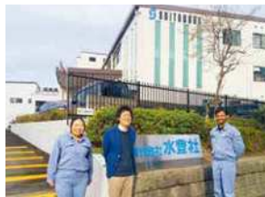
創業以来、変化をチャンスとしてとらえ、成長を遂げてまいりました。