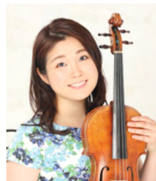
神原玲奈 ヴァイオリン