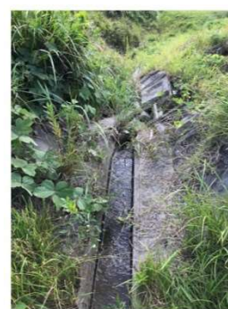
水路の閉塞・崩壊