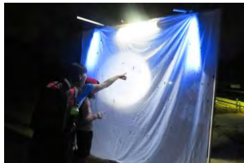
ライトトラップの様子