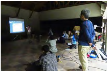
成果発表会の様子