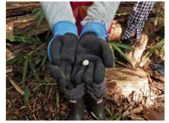
は虫類の卵を発見！（種は不明）