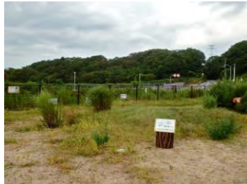
これから解説板を増やします