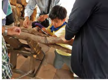
解説板を置くための土台づくり