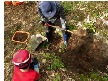
炭窯の中から土を取り除き