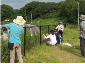
フェンスに解説板をとり付け

ヨモギなど様々な草が生育している広場で、バッタや鳴く虫が生息できる環境づくりを行っています。今回の活動では、この広場で見られる昆虫について紹介した解説板を設置しました。