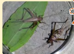
マツムシ (オス・メス) を発見