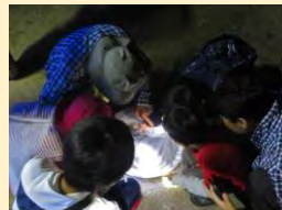
草むらに網ですくって調査