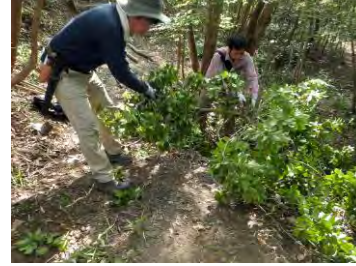
邪魔になっている木を伐採

人が暮らしのためにこの山を使っていた証拠である炭窯の跡。ササや低木、土に埋もれていたもので、炭窯のまわりの植物を伐採し、炭窯の中にたまっていた土をかき出しました。