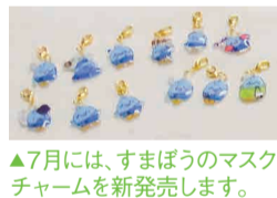
▲7月には、すまぼうのマスクチャームを新発売します。