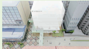
▲ 北須磨支所移転イメージ