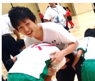
かん：児童発達支援管理責任者・保育士

利用料の1割を利用者さんに負担してもらい、世帯の所得に応じて神戸市により上限負担が決まっております。ただし、非課税世帯・生活保護世帯は自己負担なしです。