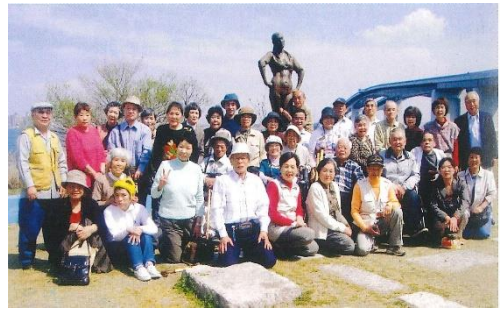
第1回 家族と一緒に家族旅行