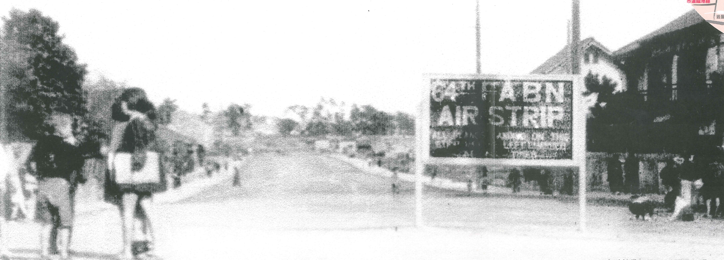
山手幹線にあった六甲飛行場 六甲口交差点付近から東をのぞむ(昭和22年頃)

今回の灘のまちなんでも座談会は、灘の道についてのウンチク話。地元の人しか知らないあんな道、こんな道、古い道、新しい道…。灘区初心者のあなたも、まずは道の名前を覚えて灘ツウを気取ってみましょう。