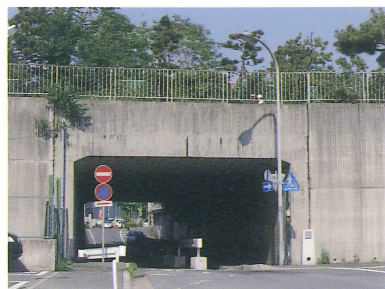
石屋川の川底トンネル（道路）

石屋川を越える JR 沿いの道は、 トンネルで川の底を抜ける。 昭和51年に国鉄（現 JR）が 高架になる前は、鉄道の川底ト ンネルがあった。このトンネル は明治4年に日本で初めてつく られた鉄道トンネル。 （供用は明治7年）