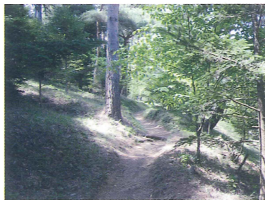
摩耶山のシェール道

六甲・摩耶にあるカタカナの名 前の道。山上でつくった氷を運 んだアイスロード、石仏や祠が あることから名付けられたシュ ラインロード、小さな滝がたくさん あるカスケードバレーなど、い ずれも六甲摩耶を訪れた外国人 によって名付けられた。