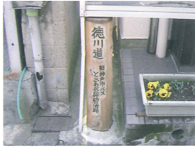
高羽郵便局前の道標

明治維新直前に居留地の外国 人と大名とのトラブルを避ける ため石屋川付近より北上し、袖 谷道から摩耶山に入り山中を明 石に抜ける西国街道のバイパス として作られた徳川道（西国往 還付替道）は幕府崩壊によりほ んど使われずに廃道となった。