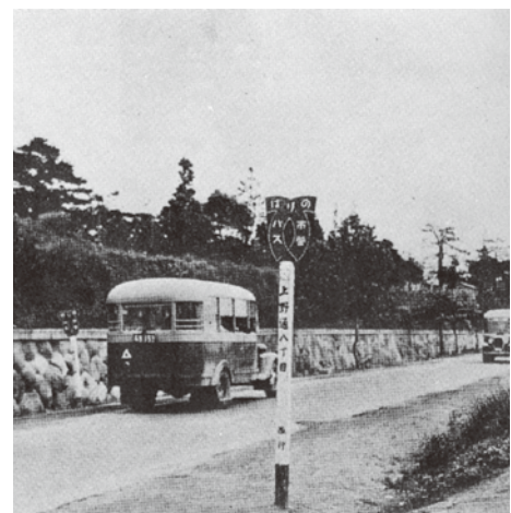
戦前の「上のバス道」(上野通)

灘区に住んでいると「上のバス道」「下のバス道」という言葉を聞いたことがあるかと思いますが。上のバス道とは現在の2系統が走っている道。下のバス道は山手幹線をさすと思われている方もいると思いますが、正確には「市電道」。下のバス道とは上筒井～大石～灘駅などを結ぶ市バス(下記いにしえの「下のバス道」に行く参照)が走っていた天城通と福住通の境を東西に走る一方通行の道をさします。ご存知でしたか？