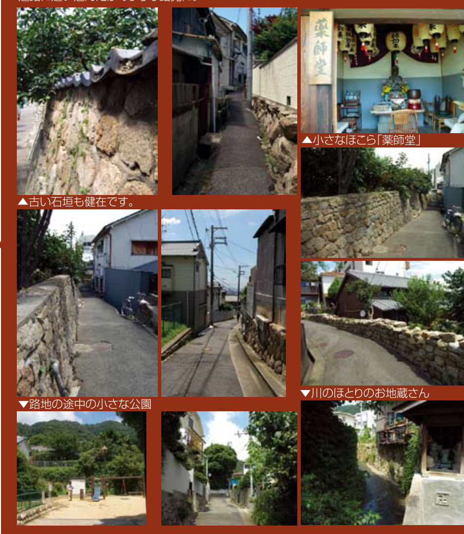
▲古い石垣も健在です。 ▼路地の途中の小さな公園 ▲小さなほころ「薬師堂」 ▼川のほとりのお地藏さん

沿道途中下車～五毛通・国玉通かいわい～ 車窓からお気に入りの風景を見つけたら、途中下車してみてもいいですか? 今まで知らなかった灘の魅力が見つかるかもしれません。今回途中下車した五毛通、国玉通かいわいは、昔からある細い路地が網の目のように走っています。もともと田畑のあぜみちを道路にしたので、くねくねとまがってまるで迷路に迷い込んだかのような錯覚に。