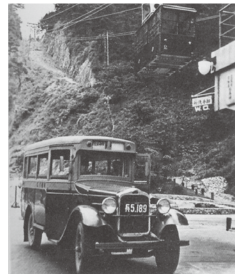
六甲ロープウェイと連絡市バス

六甲山に登る阪急登山バス、六甲山と摩耶山を結ぶ六甲摩耶スカイシャトルバス、国道2号を走る阪神国道バスなどがあります。かつては阪神大石駅と摩耶ケーブル下を結ぶ摩耶バスや阪神新在家駅と六甲ケーブル下を結ぶ六甲越有馬鉄道バス、灘駅～摩耶ケーブル下～阪神大石駅を結ぶ六甲山乗合バスなどのバスが運行していました。