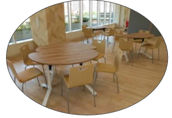
北須磨支所 3階 ミーティングスペース