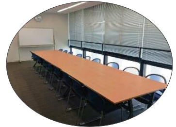
須磨区役所 3階 ミーティングスペース