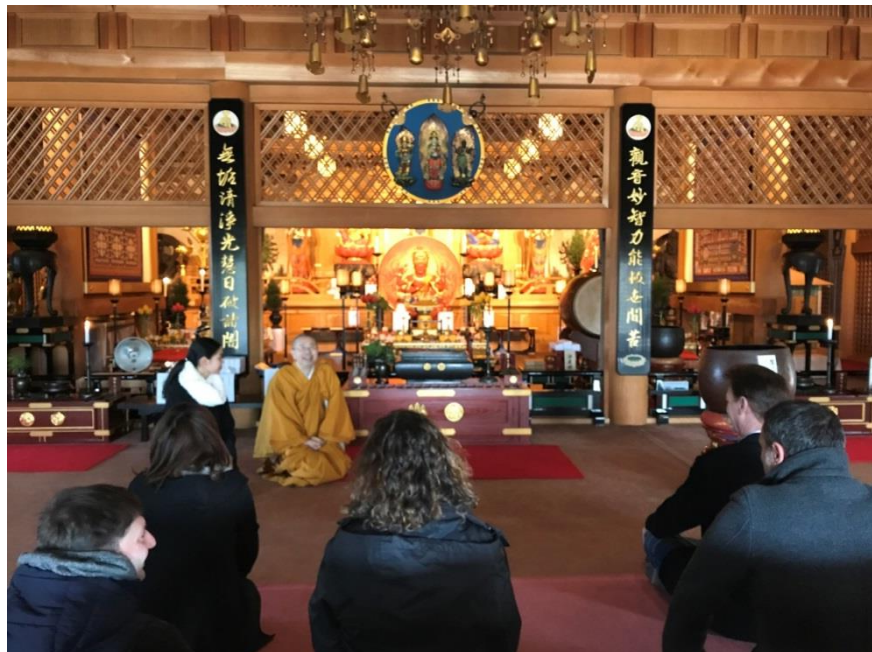
朝型プログラム体験

2020年に国立公園を訪れる外国人を1,000万人とする目標を掲げる「国立公園満喫プロジェクト」の展開事業に、山上の事業者、公共交通機関、旅行エージェント、環境省等と取り組み、六甲山への更なる誘客を図る。