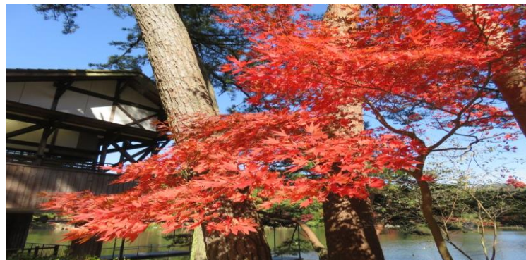
再度公園ボートハウス耐震改修等