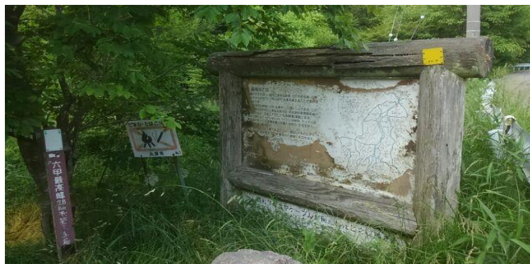
六甲山上案内サイン更新