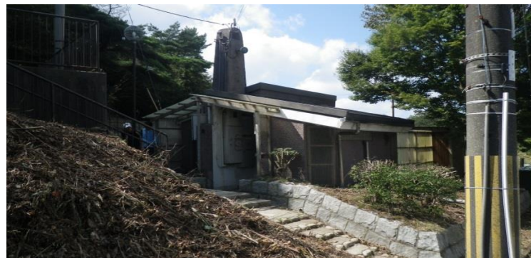
六甲最高峰トイレ改修