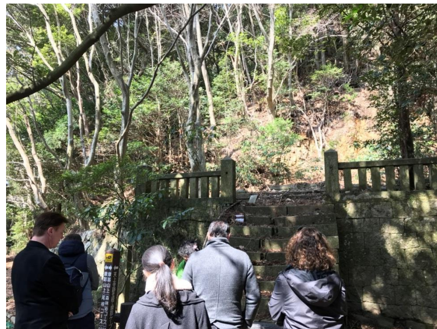
トレッキング体験