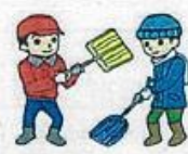
地域内における生活支援ボランティア