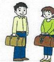
地域外からの来訪者

※地域の交通が著しく不便であることその他交通手段を確保することが必要な事情があることを市町村長が認めた場合に限る