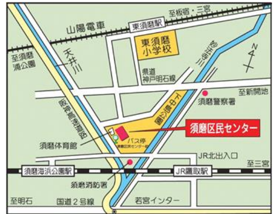
須磨区民センター 位置図