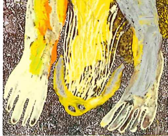
左/《夜を通るいきもの1》2020年 下/《ドクルジン》2019年

〒658-0032 兵庫県神戸市東灘区向洋町中2-9-1(六甲アイランド) TEL.078-858-1520 https://www.city.kobe.lg.jp/yukariumuseum/