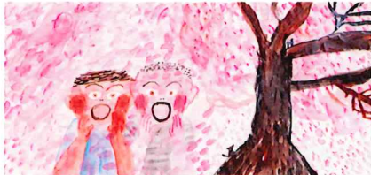
《いっしょにアムベ!》2014年 すべて@mirokomachiko