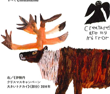
右/《伊勢丹クリスマスキャンペーン 大きいトナカイ》(部分) 2014年