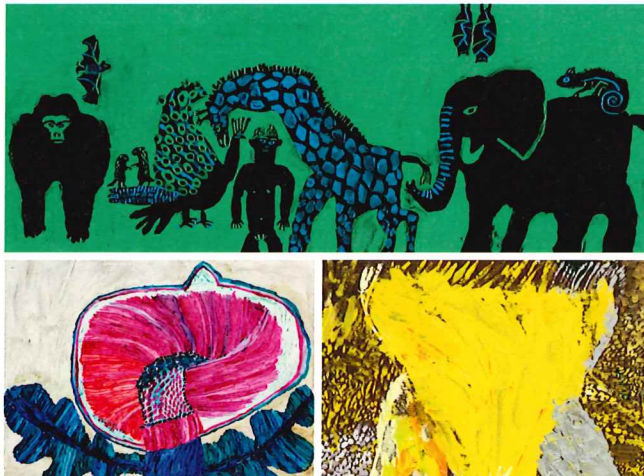
《生物進化とはたか》2016年