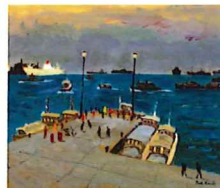
小出卓二「神戸メリケン波止場」 1972年頃 油彩・キャンバス