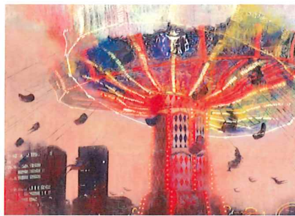
表面 「黒く街」1999年 紙本着色 当館蔵 「染まる街」2000年 紙本着色/金箔 当館蔵