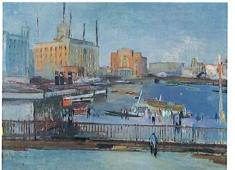
《港》1956-64年頃 神戸ゆかりの美術館