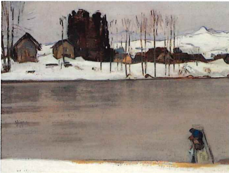
《最上川辺》1945-56年 金子コレクション