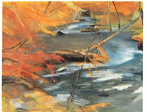
《奥入瀬》1956-64年 笠間日動美術館