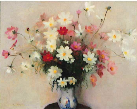
《秋桜》笠間日動美術館