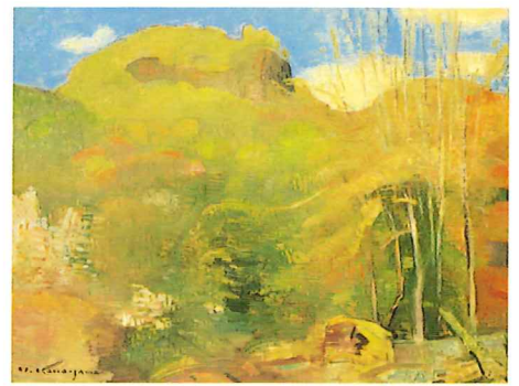
《紫明仙 春》金子コレクション