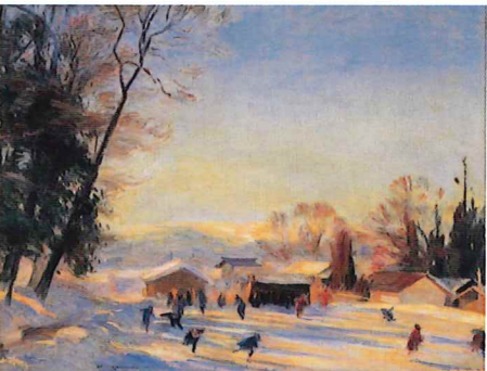
《下諏訪のリンク》1922年 笠間日動美術館