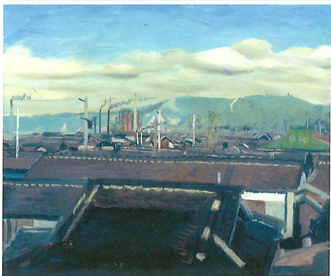
小松益喜《春日道風景》1945年頃 神戸市蔵