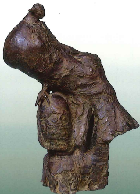
柳原義達《亀》神戸ゆかりの美術館蔵