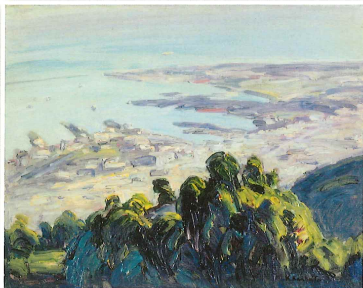
川端謹次《摩耶山より》1956年 神戸ゆかりの美術館蔵